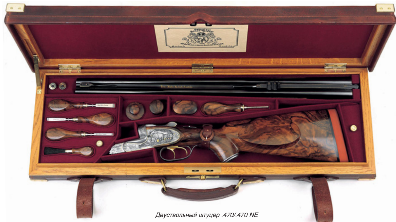
Двуствольный штуцер .470/.470 NE

будучи уложено в футляр ручной работы, легко умещается в любом рюкзаке или неброском чемодане.