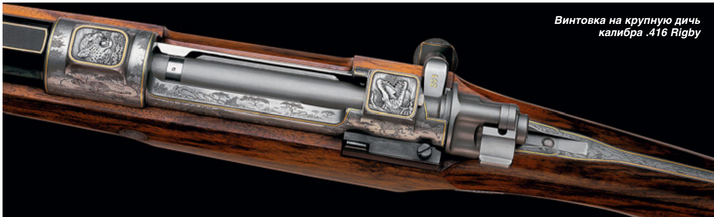
Винтовка на крупную дичь калибра .416 Rigby

птицы-секретари, грифы, орлы, антилопы куду, павианы, леопарды, гепарды.