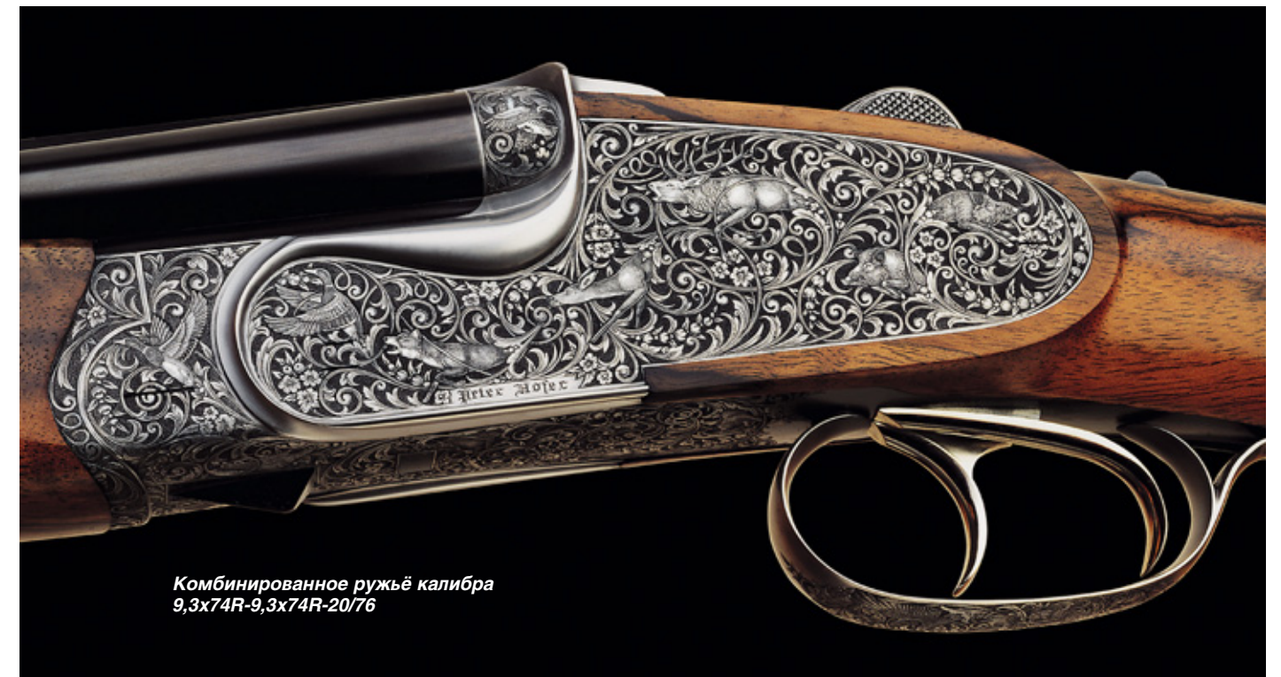
Комбинированное ружьё калибра 9,3x74R-9,3x74R-20/76

В разобранном состоянии самая длинная деталь оружия – это ствол (59 см). При поездках оружие, даже