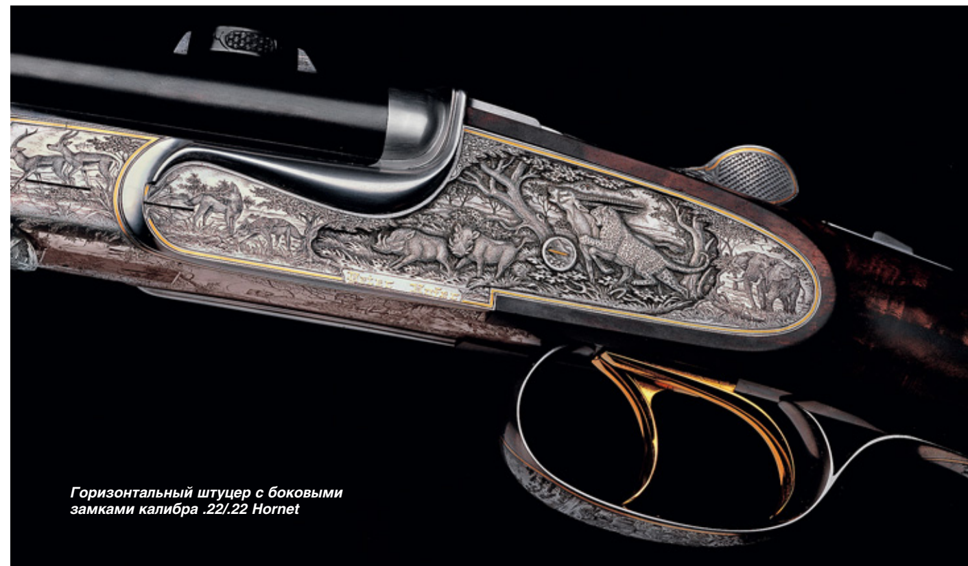
Горизонтальный штуцер с боковыми замками калибра .22/.22 Hornet

Элегантная ложа изготовлена из лучшей кавказской комлево-свилеватой древесины ореха. Все ружья африканского набора объединены одним мотивом гравировки. На африканском пейзаже изображены львы, газели, бородавочники, слоны, койоты, буйволы, бегемоты, носороги, циветты, ибисы, зебры, страусы,