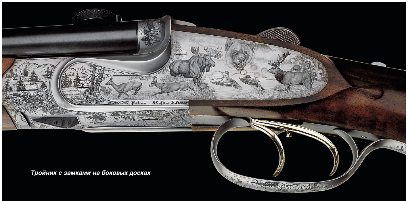
Тройник с замками на боковых досках

только одному владельцу и что двустволка «Рубенс» украшена самой тончайшей гравировкой из всех, какие когда-либо удавались человеку. Такое невозможно повторить. Петер Хофер надеется, что владелец этого ценного произведения искусства передаст его по наследству своим потомкам или продаст в именитый музей.