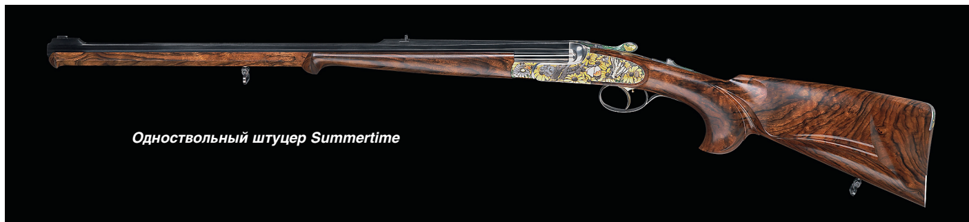
Одноствольный штуцер Summertime

Одноствольный штуцер Summertime украшен врезками из специального золотого сплава, благодаря чему в сочетании с тончайшей технологией гравировки бутини, когда под микроскопом на 1 кв. мм поверхности наносится 10 000 точек, достигается совершенно захватывающее великолепие красок. Впервые на этом ружье была применена уникальная технология эмалирования.