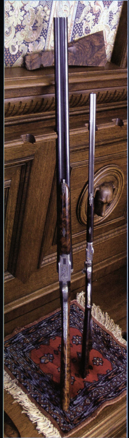
Junto a una escopeta normal apreciamos las reducidas dimensiones de este express totalmente funcional en calibre pequeño.

Pero la labor no se limita a fabricar a mano cada pieza; también se diseñan, estudian y desarrollan sistemas y mecanismos propios de la casa, que muchas veces modifican y marcan el estado de la técnica.