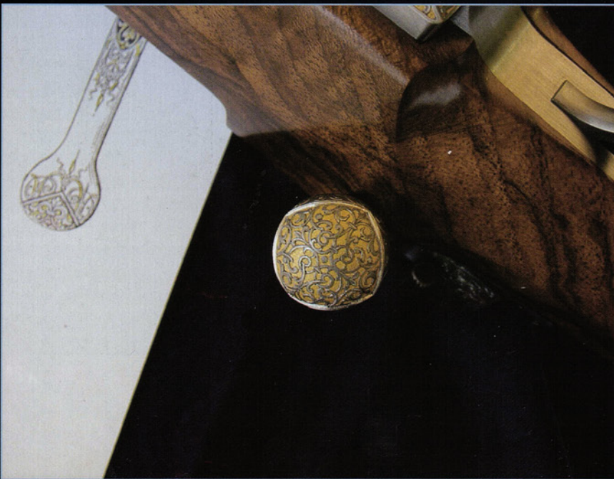
Los acabados alcanzan tal punto de elaboración que la bola del asa del cerrojo, por su parte inferior, presenta grabados de exquisita realización con los bajorrelieves en oro.