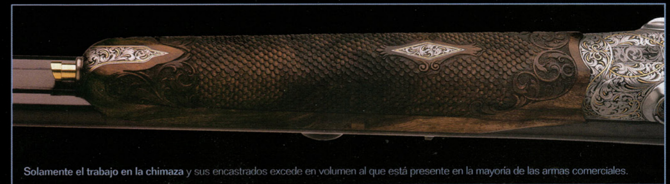
Solamente el trabajo en la chimaza y sus encastrados excede en volumen al que está presente en la mayoría de las armas comerciales.