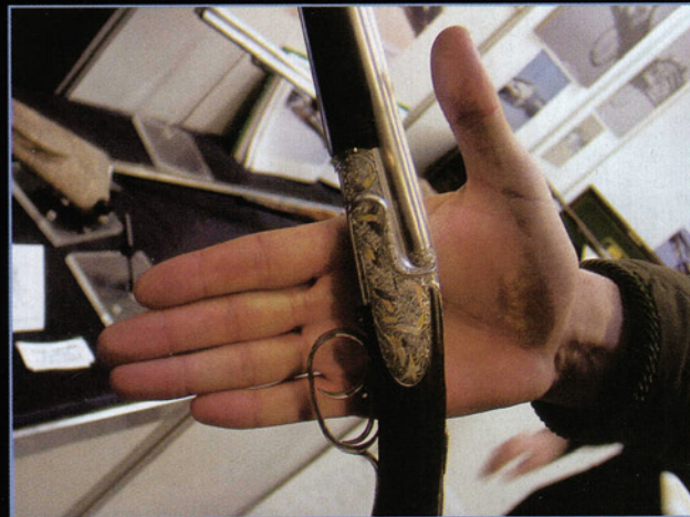
Éste es un express "de verdad" que dispara un cartucho pequeño y tiene la misma calidad de acabados y terminación que el más exquisito de los express grandes.