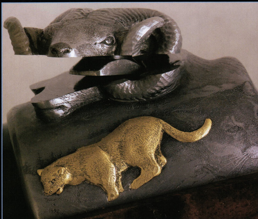
Aunque a primera vista dé esa impresión, no está roto. En la montura del visor está lo que falta de la cabeza del muflón, que se completa al montarlo. Una idea admirable.