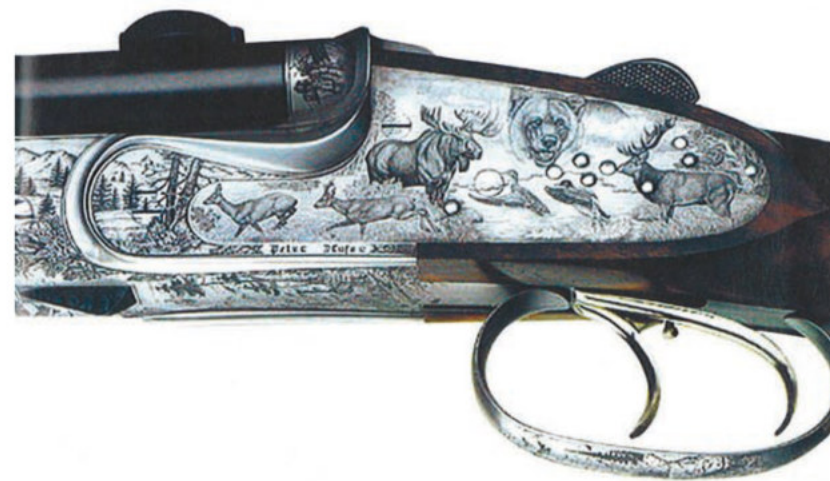
Ez a meglepő, oldallakatos fegyver egy igen eredeti drilling, három különböző kaliberű csővel: 8x75 RS, 6,5x65 R és .410 Mag.

A biztosító tolokájával lehet kiválasztani, melyik cső tüzeljen. Az első elsütőbillentyű a két huzagolt cső egyikét-másikat vezérli, míg a második csak a .410 magnumot. A baszkül oldala különösen eredeti, a bulinogravírozás pedig – amelyen ott találjuk az északi félteke összes nagyvadát és néhány kacsát is – szó szerint káprázatos.