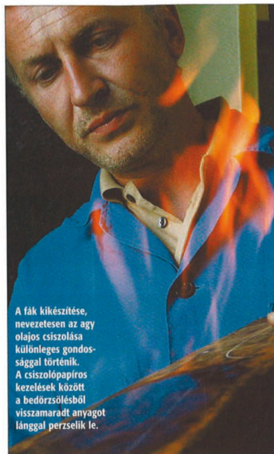
A fák kikészítése, nevezetesen az agy olajos csiszolása különleges gondossággal történik. A csiszolópapíros kezelések között a bedörzsölésből visszamaradt anyagot lánggal perzselik le.