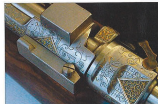
Még a tolzásos puskákon is van mit újítani. Itt is ez történt egy kevésbé szokványos, különlegesen finom gravírozással