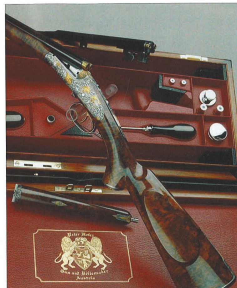
Teljes puskaszett, díszdobozzal