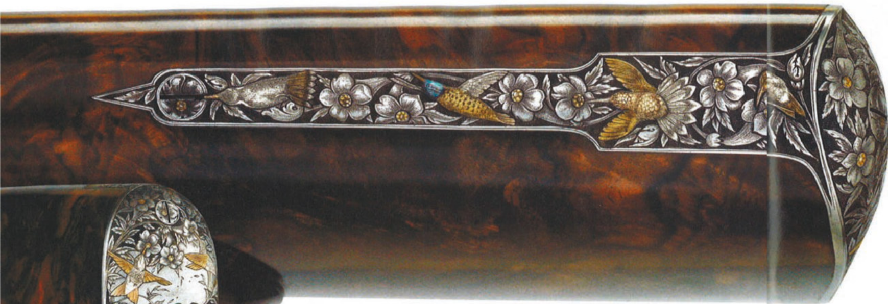
Fantasztikus fegyverkészlet négy dupla csövű sörétesből és egy oldallakatos bockból, amely a 12-estől a .410 magnumig az összes használatos kalibert felvonultatja