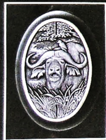
Unten: Das Pistolengriffkämpchen zeigt einen Kaffernbüffel.

Insgesamt sind die gravierten Szenen ein einzigartiges Dokument der frühen Geschichte der Jagd in einer Hochkultur.