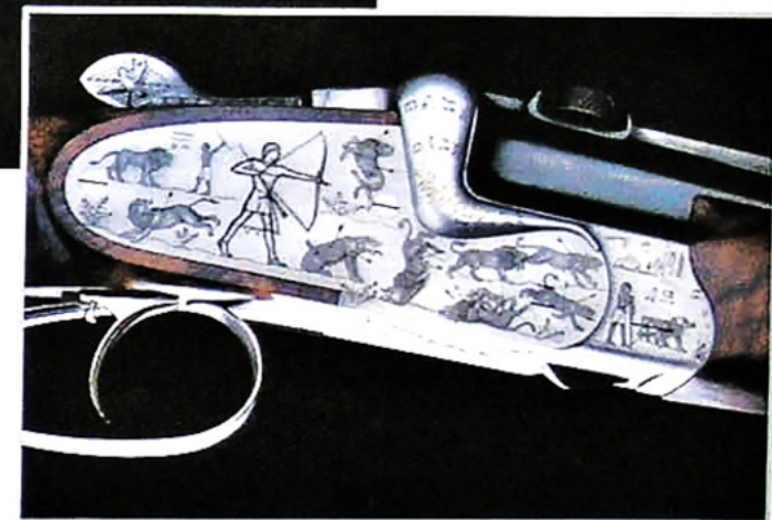
Links und unten: Das ägyptische Altertum inspirierte zu den Gravuren an dieser Bockdoppelbüchse: Auf der Scheibe und Basküle sind Hieroglyphen eingearbeitet, die Seitenplatten zieren Darstellungen von Löwenjagdszenen, wie sie auch in ägyptischen Grabkammern zu finden sind.

Über fünf Reihen verteilt finden sich auf der Waffe die Tiere wieder, die Pharao Ramses der III. im alten Ägypten gejagt hat.