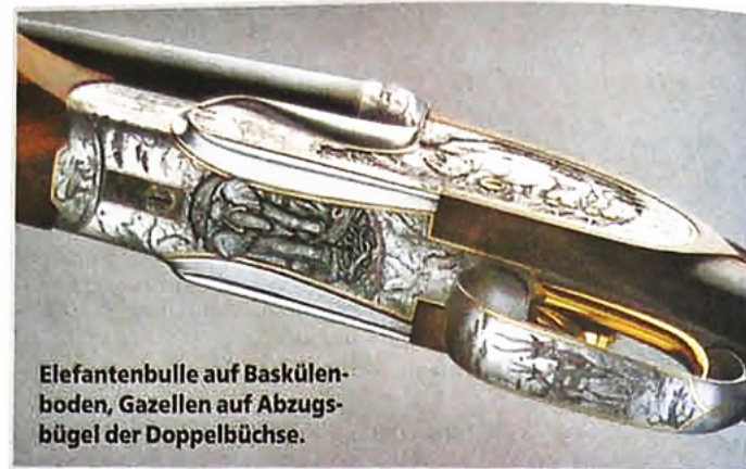
Elefantenbulle auf Baskülenboden, Gazellen auf Abzugsbügel der Doppelbüchse.

Bei der Doppelbüchse im Kaliber .470 NE mit Koffer fällt wieder der wuchtige Hinterschaft