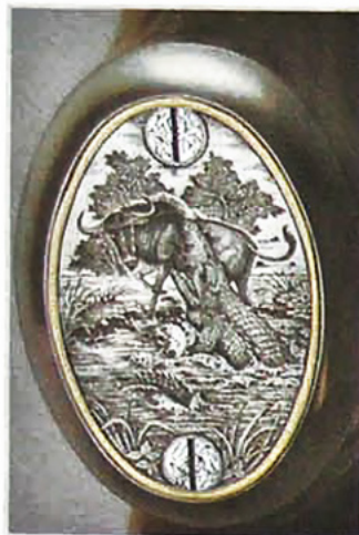
Oben: Krokodil reißt Gnu – das ist die Szene auf dem Pistolengriffkappchen der .470 NE.

Auf der rechten Seitenplatte besteht die in Reliefgravur ausgeführte Hauptszene aus zwei grasenden Nashörnern. Weiter vorne ist ein Springbock auf der Flucht und im Bereich des Scharnierstifts äugen zwei Büffel etwas griesgrämig. Auf der linken Seitenplatte sind zwei wütende Elefantenbullen abgebildet. Auf der Verstärkung unterhalb des Stoßbodens ist ein Waran graviert. Links darun-